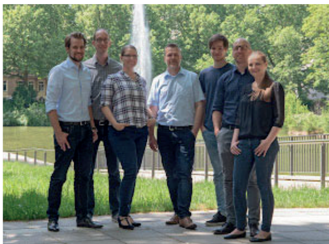
Das Team der localizez GmbH holte den dritten Platz.

Um die Gründerszene in Baden-Württemberg sichtbar zu machen, verleiht der Sparkassenverband Baden-Württemberg seit 1997 den Gründerpreis an Startups mit überzeugendem Businessplan.